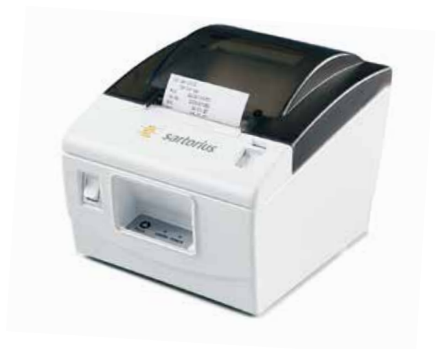
Plug & Play 标准打印机 YDP40

大号的水平调节轮以及便于观测的水平指示气泡，使您可以轻而易举地完成Practum®天平的水平调节，确保称重结果具备出众的重复性和精确性。